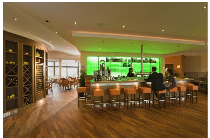
Bar im Airporthotel Paderborn