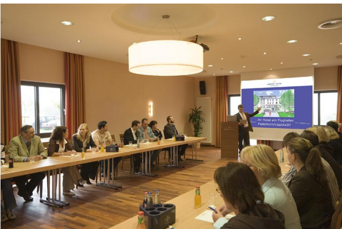
Seminarraum im Airporthotel Paderborn