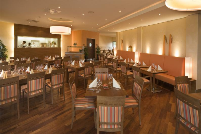
Restaurant im Airporthotel Paderborn