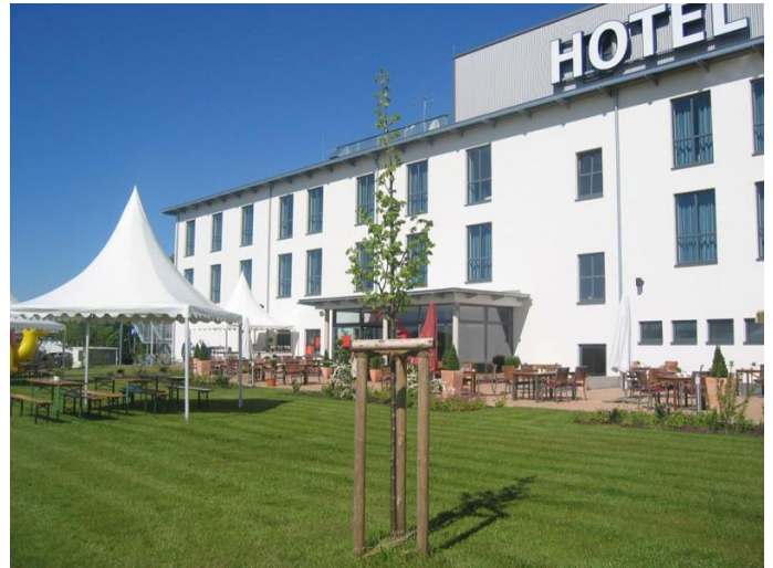
Außenansicht/Terrasse Airporthotel Paderborn