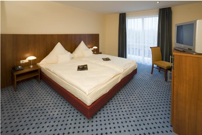
Zimmer im Airporthotel Paderborn