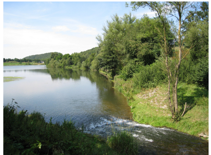
Keddinghäuser See