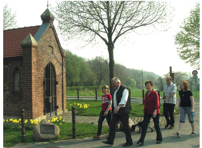
Wandergruppe an der Markuskapelle Quelle Stadt Büren