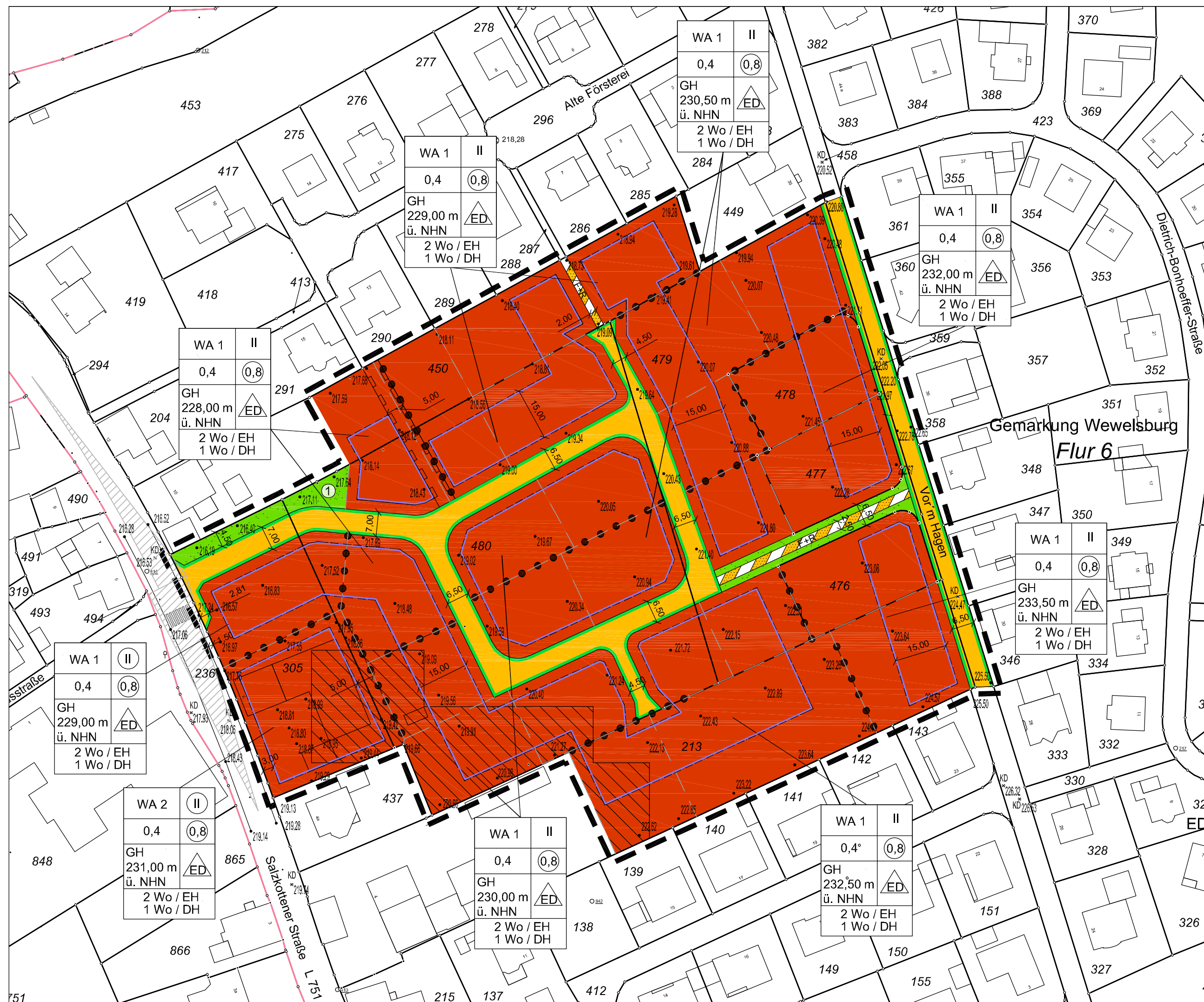
Bebauungsplan Nr. 10 "Vor'm Hagen II"